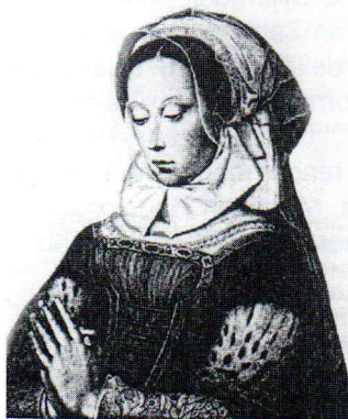
Jacoba van Beieren is 14 jaar als ze trouwt met de 9 jarige Jan van Touraine.